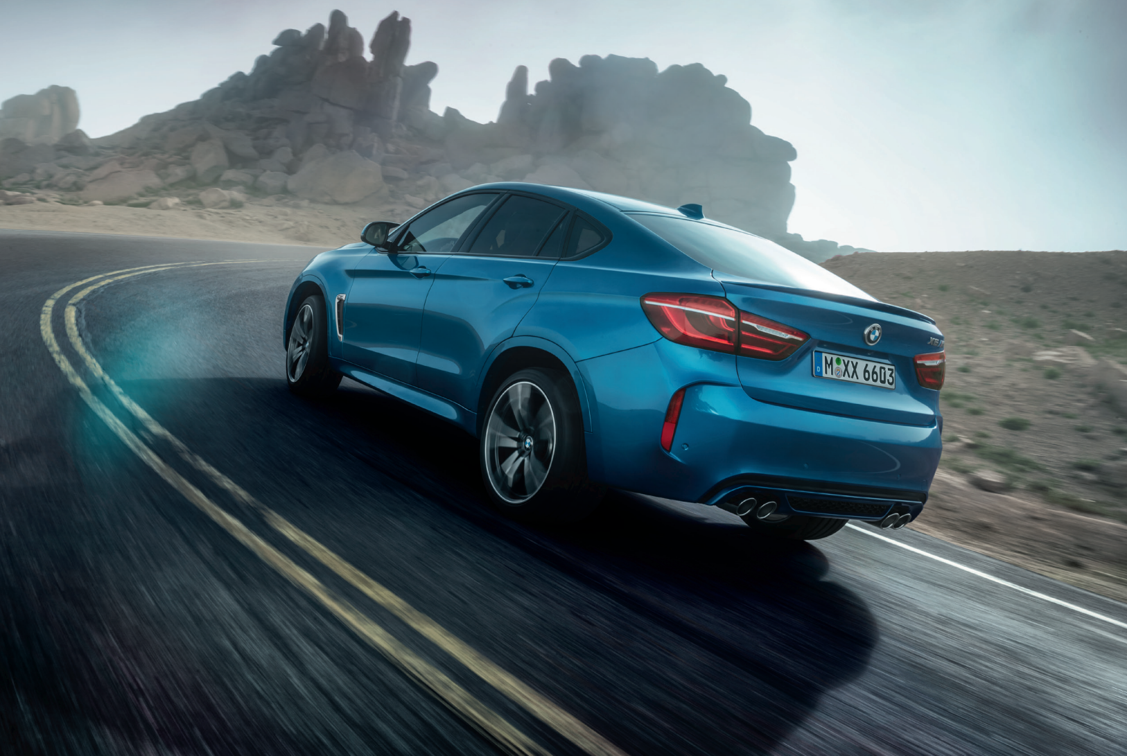
Imagen únicamente ilustrativa.